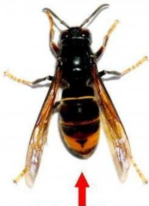
Frelon asiatique (taille réelle 3 cm)

À savoir : la destruction des nids de frelons n'est pas obligatoire, mais si vous n'y avez pas procédé, vous seriez tenu pour responsable si quelqu'un se faisait piquer.