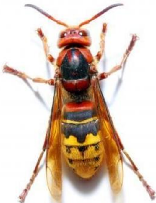
Frelon commun (jusqu'à 4 cm)